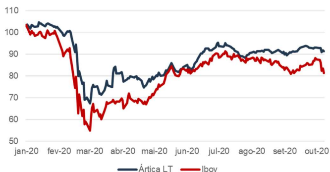
Ártica LT vs Ibov (jan-20 = 100)