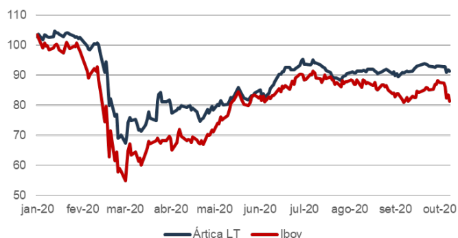
Ártica LT vs Ibov (jan-20 = 100)